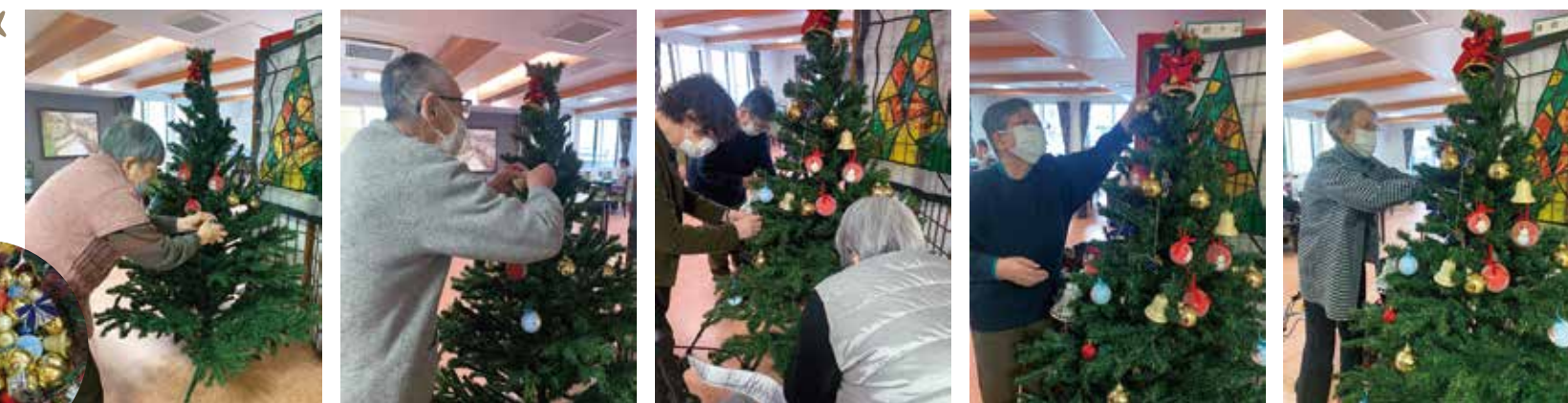
今年もクリスマスツリーの飾り付けを皆様に協力していただきました☆