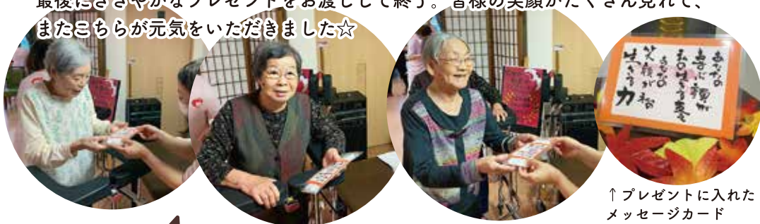
↑プレゼントに入れたメッセージカード

最後にささやかなプレゼントをお渡しして終了。皆様の笑顔がたくさん見れて、またこちらが元気をいただきました☆